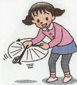
メリーゴーランド